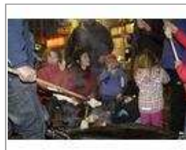
Beim Stockbrot machen hatten die Kinder viel Spaß