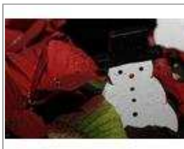
Der Holzschneemann hat viel Regen abbekommen.

Viel zu tun hatten die Malteser im Kaufhof. Das Warenhaus gibt den Maltesern an den Adventswochenenden Gelegenheit Spenden zu sammeln. Die Malteser packen dort Geschenke ein und bitten hierfür um freiwillige Spenden. Der Service wurde schon von vielen Menschen genutzt.